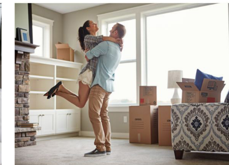
Ils achèteront une belle maison.