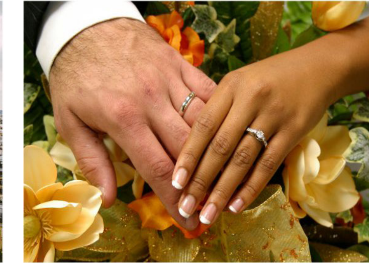
Ils se marieront.