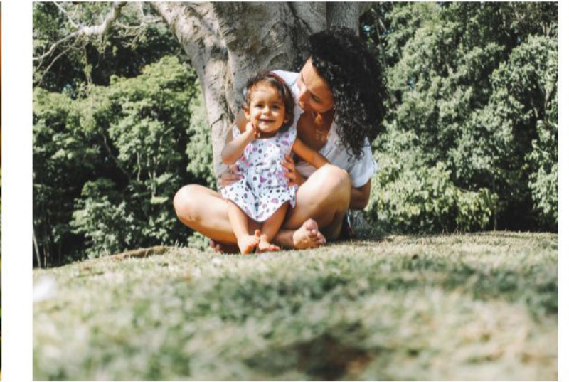
Ils auront une fille.