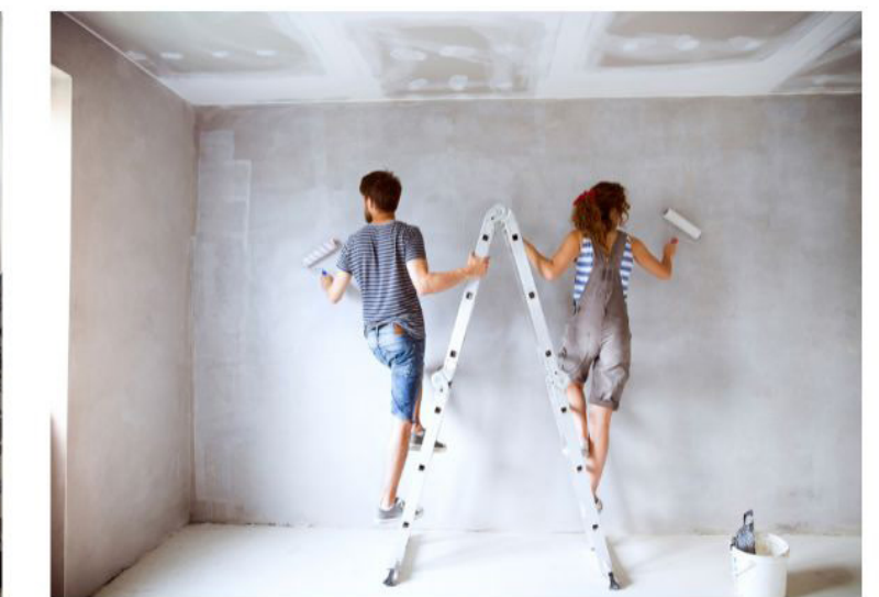
Ils feront des travaux.