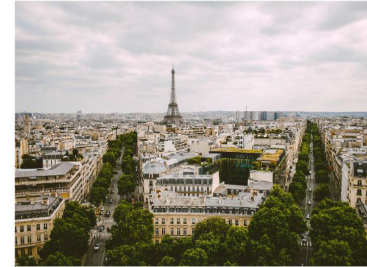
Ils habiteront à Paris.

Emma a 20 ans. Elle imagine sa vie dans 10 ans avec Paul, son fiancé. Faites des phrases au futur simple en vous inspirant des photos.