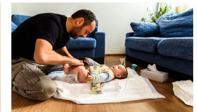
Son mari s'occupera du petit.