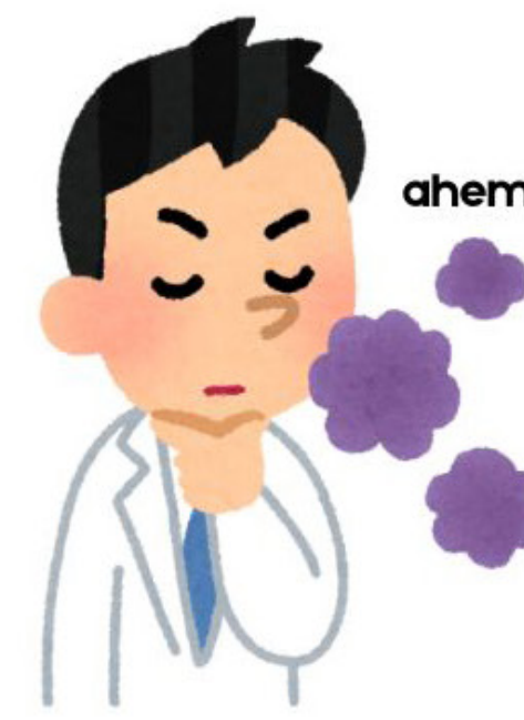
se racler la gorge

Complétez les phrases avec : éternuer, renifler, tousser, se racler la gorge, avoir le hoquet, bâiller . Conjuguiez les verbes si nécessaire.