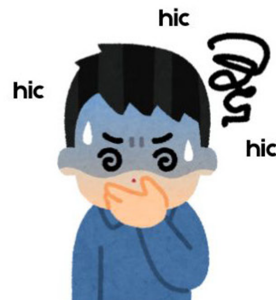
avoir le hoquet