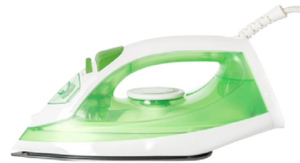
un fer à repasser