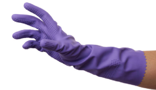
un gant de nettoyage