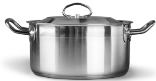
une marmite, un faitout avec couvercle