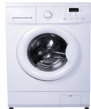
une machine à laver