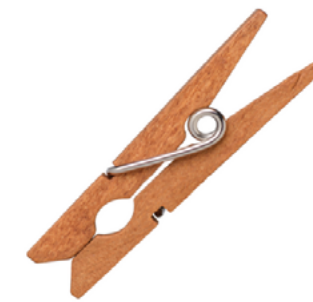
une pince à linge