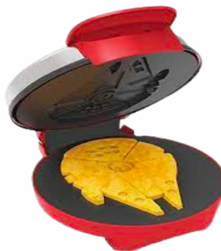
Gaufrier Star Wars