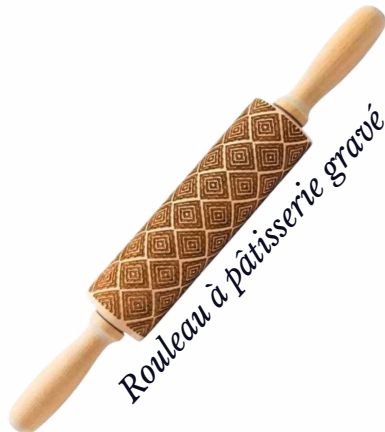
Rouleau à pâtisserie gravé